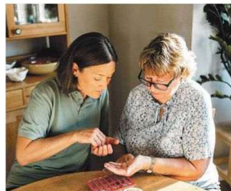
In 2025 hadden 3,5 miljoen Nederlanders last van medicijntekorten.

Bijna een op de drie medicijngebruikers had in 2025 last van de tekorten. Dit zijn 3,5 miljoen Nederlanders, blijkt uit cijfers van apothekervereniging KNMP. „Sommige mensen krijgen klachten omdat het alternatieve middel bijwerkingen geeft of minder goed werkt”, zegt Olof King, directeur belangenbehartiging bij de Consumentenbond.